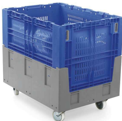
400 010 Option roues pivotantes