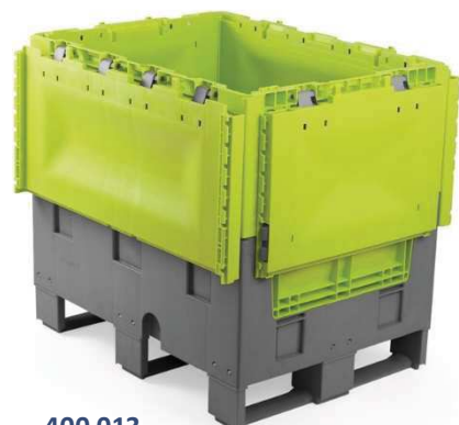
400 013 Option 3 semelles