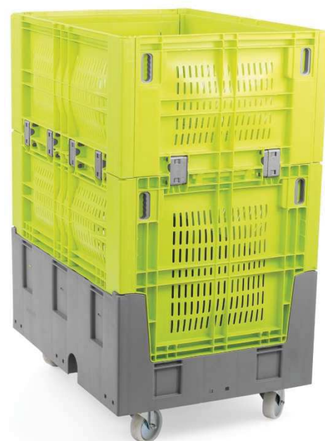
400 012 Option roues pivotantes