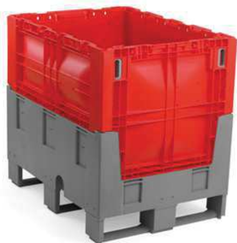
400 011 Option 3 semelles