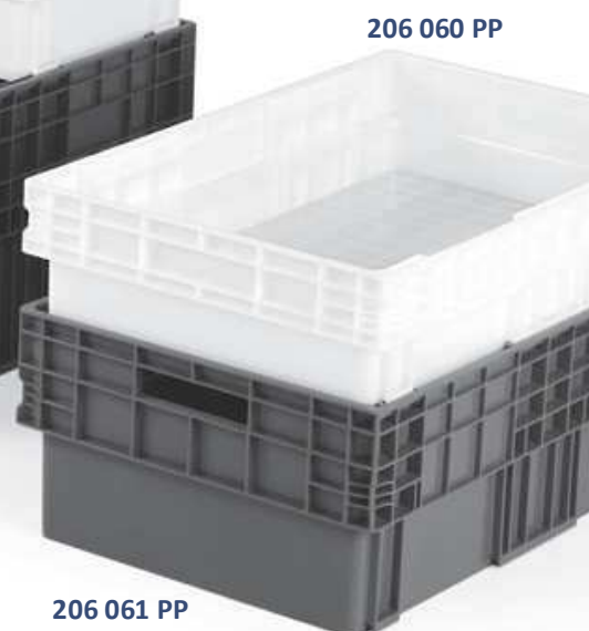
206 060 PP