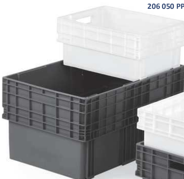
206 050 PP